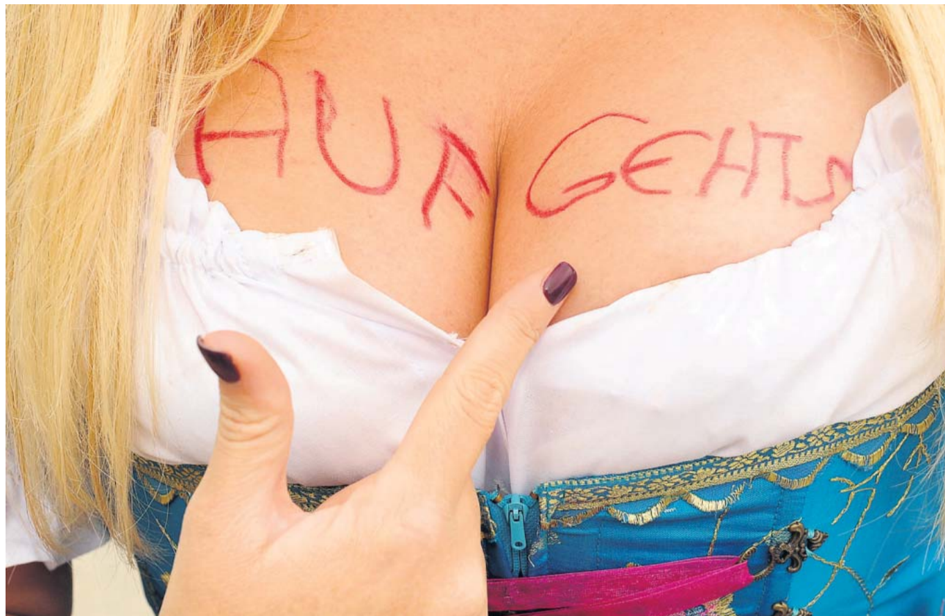
Auf der Wiesn lassen sich mit dem Dirndl sogar Preise gewinnen – wie hier im Wettbewerb „Pressefoto Bayern 2009“.

Ven Wahrenberger Kantonsschule Limmattal, Udorf